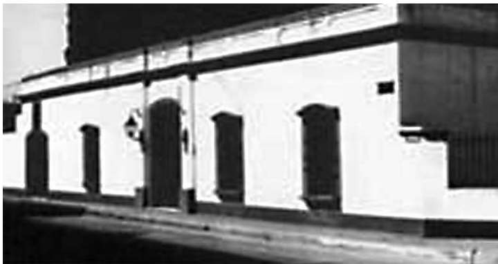
Francisco "Pancho" Ramírez, el "Supremo Entrerriano", y su medio hermano, Ricardo López Jordán (quien gobernó Entre Ríos en 1820), pasaron parte de su infancia en esta casa de fines del siglo XVIII. El edificio se encuentra en Concepción del Uruguay sobre la calle Supremo Entrerriano 58 y fue declarado monumento histórico el 25 de junio de 1975.

No es pa' cantar la milonga que los convido a la fiesta en las patriadas como esta el baile es de meta y ponga si la bala no rezonga duebla el valiente sus bríos naides sienta escalofríos cuando chifle la coruja frente al clarín que repuja Gritemos ¡ Viva Entre Ríos!!!!