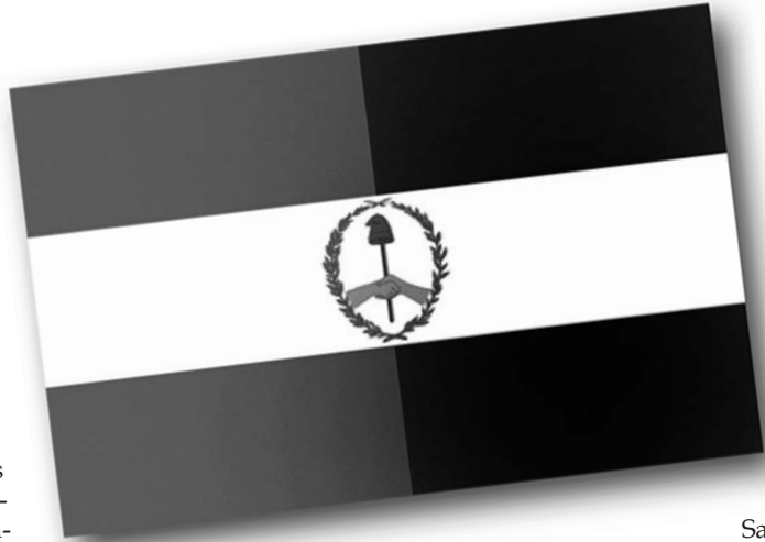
Bandera de la efímera República de Entre Ríos.

Pidiendo ayuda a Lécór para batirlo a Artigas, el director Rondeau encara la guerra definitiva contra la montonera federal. Pancho Ramírez y Estanislao López se vienen lento sobre Buenos Aires. El Ejército del Norte, que cumpliendo órdenes oficiales marcha en apoyo del gobierno, se suble-