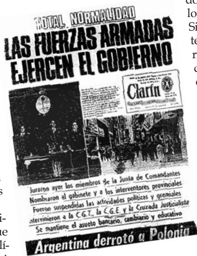
Tapa del Diario Clarín del 25 de Marzo de 1976

El Movimiento Nacional entendido como el otro nombre de la Argentina, la organización política principal del pueblo, se ha sumergido nuevamente en el subsuelo de la Patria. Tal vez tuvo una ocasión, muy tenue, de reunirse el 10 de diciembre