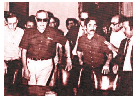
Cámpora, flanqueado por Abal Medina y Rucci